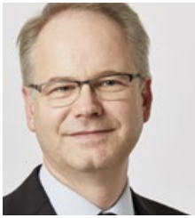
CARSTEN KNOP Frankfurter Allgemeine Zeitung Frankfurt/Main