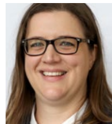
DR. GWEN KAUFMANN Deutscher Fachverlag GmbH m+a Internationale Messemedien Frankfurt/Main