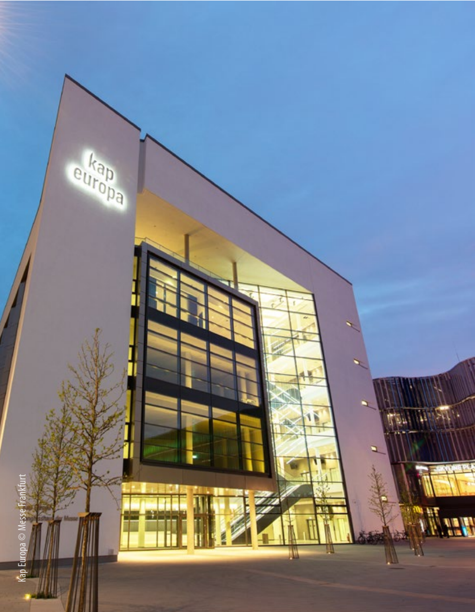
Kap Europa