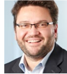
CHRISTOPH HINTE HINTE Messe- und Ausstellungs-GmbH Karlsruhe