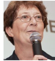
CHRISTIANE APPEL Deutscher Fachverlag GmbH m+a Internationale Messemedien Frankfurt/Main