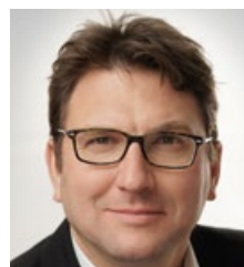
BERNHARD KLUMPP HINTE Messe- und Ausstellungs-GmbH Karlsruhe