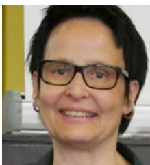
CAROLINE ZÖLLER ForTeam Kommunikation GmbH Köln