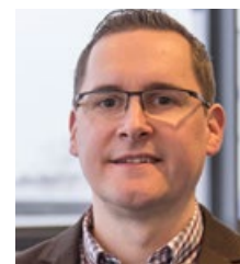
ULRICH BALDAUF AFAG Messen und Ausstellungen GmbH Nürnberg