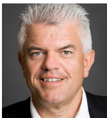
BRUNO WALTER ITB Advisory PRÄTTO Consulting GmbH Innsbruck