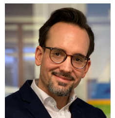
MAIK HEISSER AFAG Messen und Ausstellungen GmbH Nürnberg