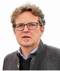
JOSEF ALBERT SCHMID JWS GmbH Mörslingen