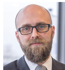
THILO KÖNICKE AFAG Messen und Ausstellungen GmbH Nürnberg