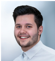
VINCENZ HINTE HINTE Marketing & Media GmbH Karlsruhe