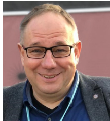
NILS SCHOEPE Frankfurter Buchmesse GmbH Frankfurt/Main