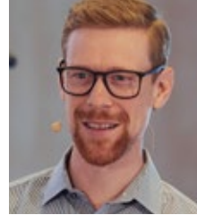
HARALD KIRCHSCHLAGER Messe München GmbH München