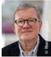
HELMUT M. BIEN westermann kommunikation Gesellschaft für Publizistik mbH