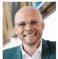
DR. FABIAN MEHRING MdL, Bayerischer Staatsminister für Digitales